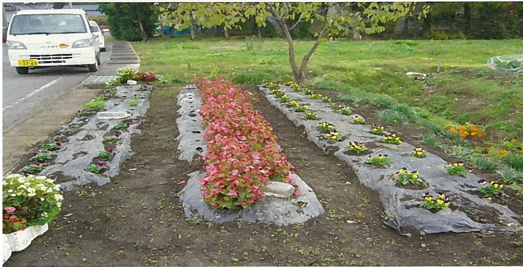
花の植栽活動 【阿弥陀花壇】