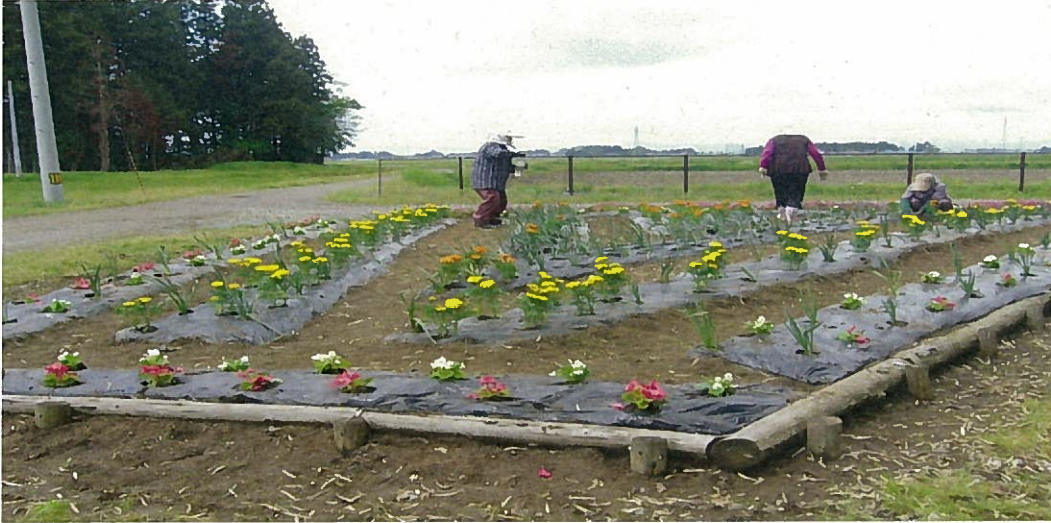
花の植栽活動 【成田花壇】