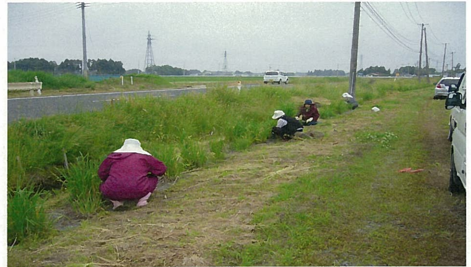
花の植栽活動 【アヤマメ園の除草作業状況】