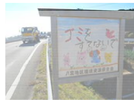
【環境浄化ポスター】