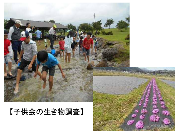
【子供会の生き物調査】

草刈りなどの保安全管理活動や農村環境保全活動は、地域住民全員参加型を指向しており「自分たちの地域を自分たちで守る」という意識の醸成にも配慮していきたい。